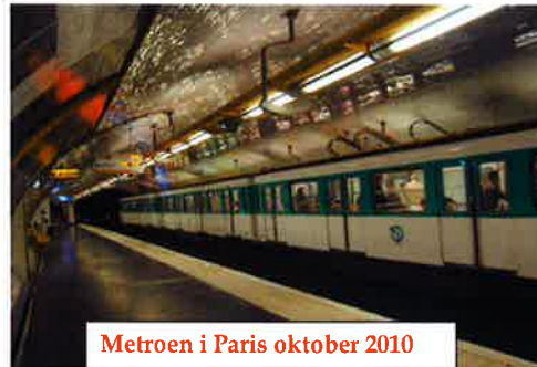
Metroen i Paris oktober 2010

Præmierne vil blive uddelt til de dygtige/heldige på klubmødet den 14. oktober.