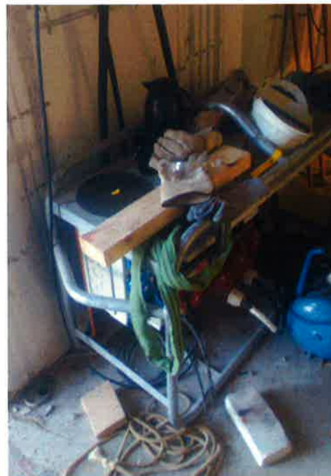
Billed er taget på KUA februar 2011

Dansk El-Forbund Kbh. har gennem de seneste par år haft fokus på organisering, og det er der kommet en masse gode tiltag ud af, men det kan ikke stå alene. Organisering starter hos dig selv! Er du medlem? er din makker? Har du husket at tale med lærlingen om det vigtige i