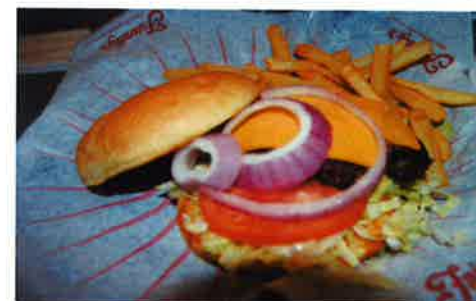
Medium burger fra USA – juni 2010