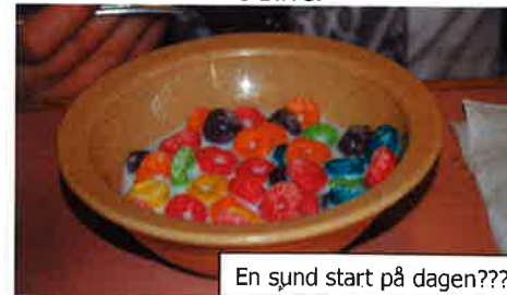
En sund start på dagen???