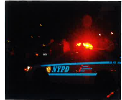
Lige som at være med i en film