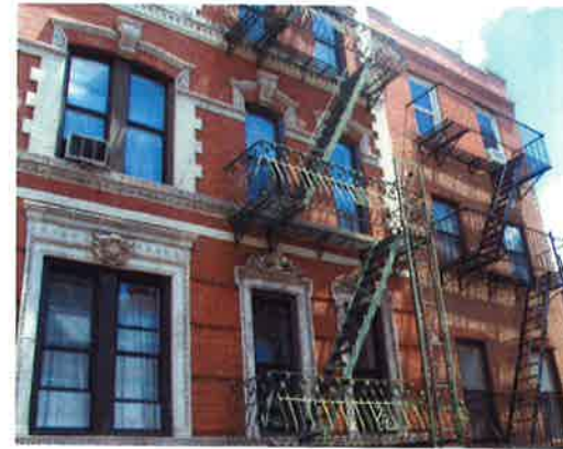
Mere typisk New York kan det næsten ikke blive.