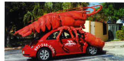
Reklamebil for Lobster House – USA juni 2010

Efter klubben opfattelse kommer der for få medlemmer til klubmøderne. Vores forventning til det udvidede klubmøde er, at det vil kunne tiltrække en bredere del af medlemmerne end dem der normalt kommer til klubmøderne, og vi derigennem kan løfte interessen for klubmøderne. Ideen til forslaget kommer fra klubben i Glenco, der har god erfaring med en tur til LO-skolen.