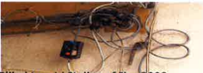
Billed taget i Italien af Ib - 2009

Hvert billede får et nummer, og bliver lagt på hjemmesiden hurtigst muligt.