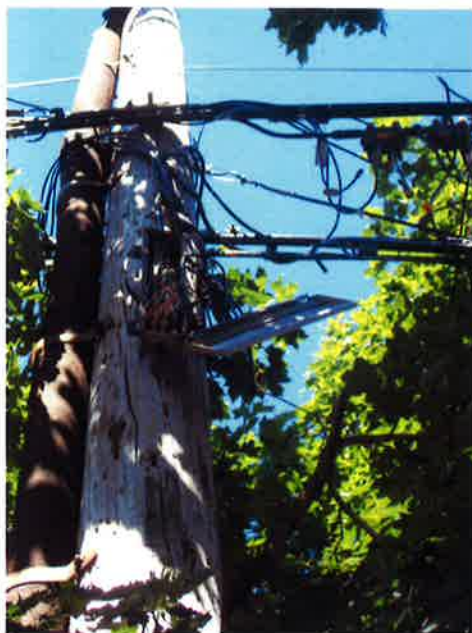
Billed fra USA – NY, juni 2010

Det er klart, at vi alle på en eller anden måde har oplevet, at krisen har ramt os. Nedgang i indkomst m.m. Men når det er sagt syntes jeg vi skal se fremad, og håbe at det vender i 2011, og vi kan komme videre.