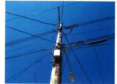
På kryds og tværs i USA. Et sted så vi Et lyssignal med 18 lysreguleringer der gik på tværs af en gade