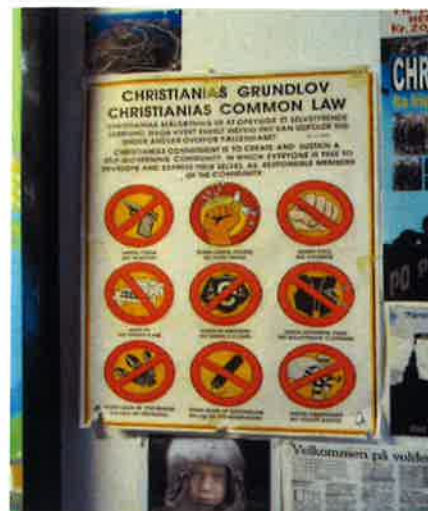
Fra skovturen 2010 Christiania