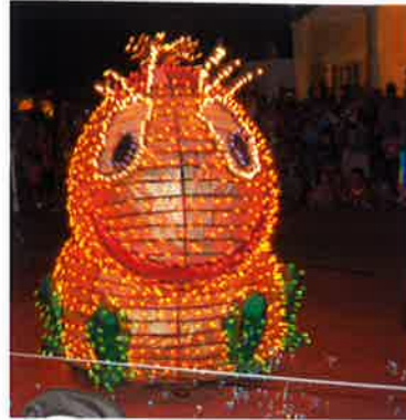
Taget i Disney World – USA 2010.

Du stemmer ved at sende en mail med dine favoritter nr. 1, 2 og 3, til Tonny´s mail