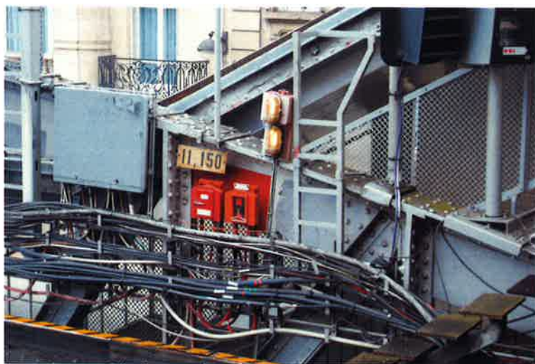
Billed taget på station i Paris oktober 2010

I DANSK EL-FORBUND KØBENHAVNS AFDELINGS LOKALER, TIKØBGÅDE 9 2200 KØBENHAVN N.