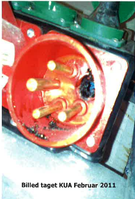
Billed taget KUA Februar 2011

Det handler ikke om ansvar og skyld, men om at forstå og handle.