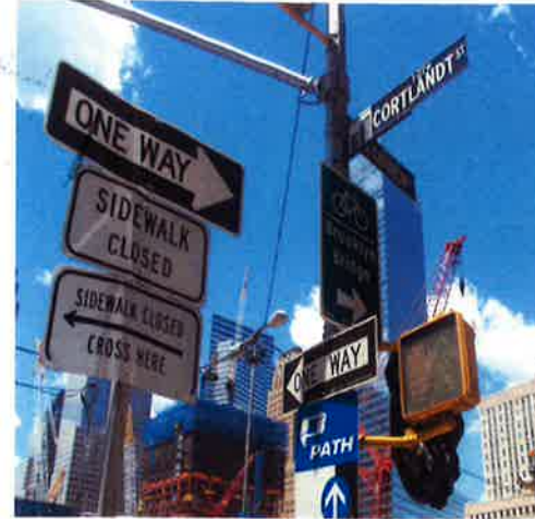
Vejviser ved Ground Zero – juni 2010

Billedside – Eller siden der blev i overskud