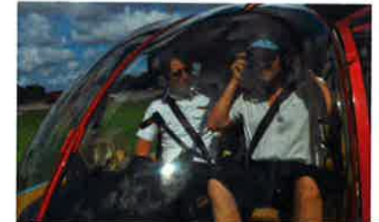
Roger over.....Hallo Hallo Yes Yes Jeg styrer for VILDT