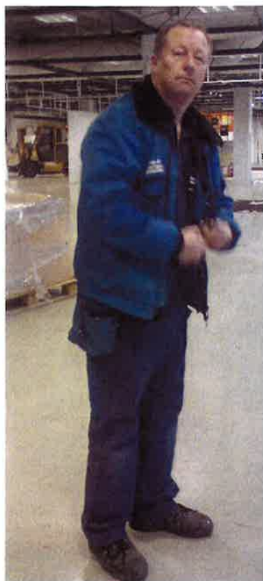
LEGO havde også bygget en K & L elektriker :O)