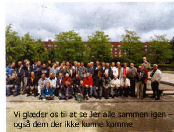
Vi glæder os til at se Jer alle sammen igen – også dem der ikke kunne komme