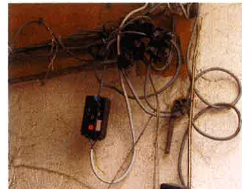
Ib har været på Sicilien

Vi står overfor en stor udfordring i den kommende tid med lav tilgang af arbejde og lave priser på vores tilbudsgivning, men vi må ikke glemme at sikkerheden stadigvæk skal være i front, vi skal ikke