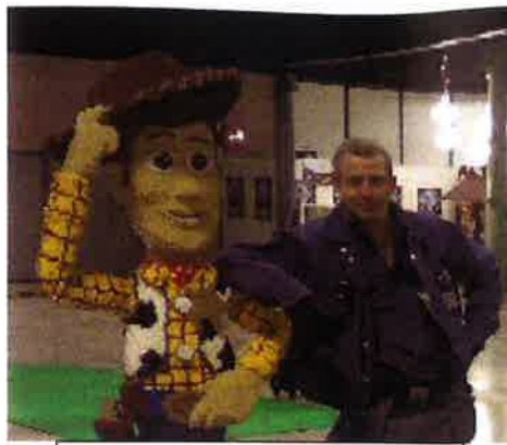
Hvem er Johnny Frem Frem og hvem er Woody???

grupperne, i at observere og forudse farlig situationer og uheld, før de opstår. Sikkerhedsudvalget undersøger muligheden for at afvikle kurset.