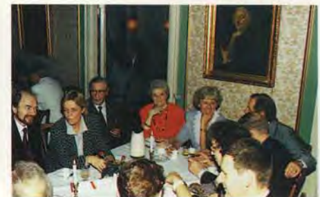
Festdeltagere i gang med kaffe og cognac på Nimb